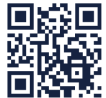
ร้านหนังสือธรรมนิติ Dharmniti Book Store