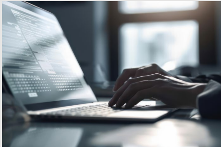
บริการด้านตรวจสอบภายใน Internal Audit Service