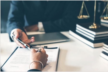
บริการด้านกฎหมายและภาษีอากร Legal and Tax Service

ธรรมนิติคือผู้ให้บริการด้านวิชาชีพครบวงจรสำหรับธุรกิจ Integrated Professional Services