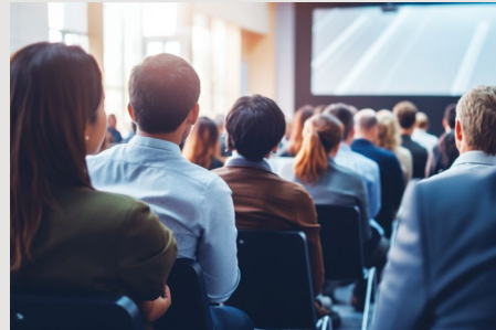
บริการด้านอบรม สื่อสิ่งพิมพ์ และไอที Training, Publishing and IT Service

กลุ่มบริษัทธรรมนิติ มุ่งหวังที่จะเป็นสถาบันวิชาชีพที่สนับสนุนการปฏิบัติงานตามความต้องการของลูกค้าในด้านต่างๆ ด้วยบุคลากรที่มีประสบการณ์ และความรู้ความสามารถเฉพาะทางที่แข็งแกร่งและเป็นปัจจุบัน เพื่อเป็นการแบ่งเบาภาระของลูกค้าให้สามารถทุ่มเทเวลาอย่างเต็มที่ในการบริหารจัดการองค์กร และขยายกิจการให้เติบโตต่อไปในอนาคตได้อย่างยั่งยืน