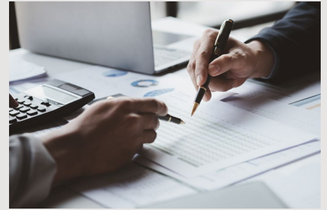
บริการด้านสอบบัญชี Audit and Assurance Service