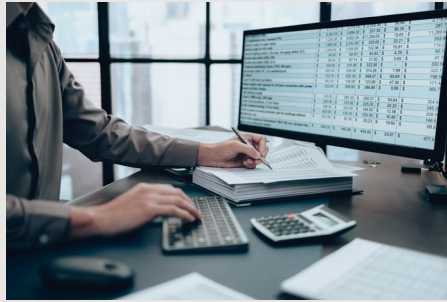
บริการด้านบัญชี Accounting and Tax Service